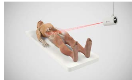
Ortoma Guide™ med ett IR-baserat enkamerasystem