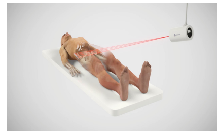
Ortoma Guide™ med ett IR-baserat enkamerasytem