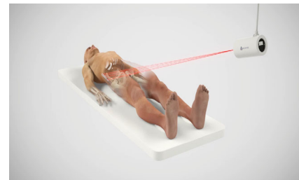
Ortoma Guide™ med ett IR-baserat kamerasystem