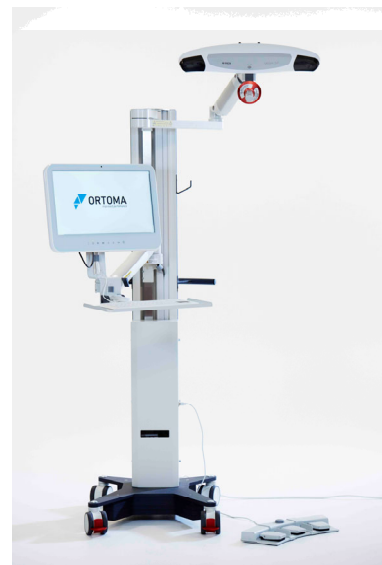
Ortoma Hip Guide™