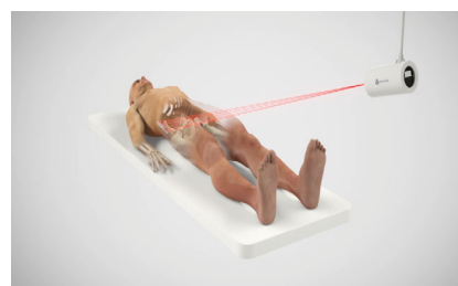
Ortoma Guide™ med ett IR-baserat enkamerasystem