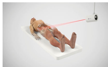
Ortoma Guide™ med ett IR-baserat enkamerasytem